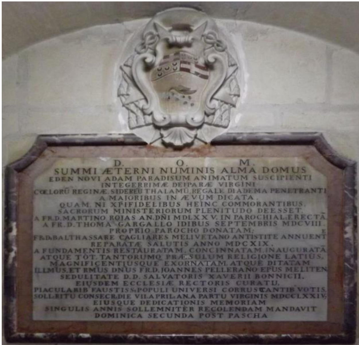
Il-lapida li illum insibu fil-kuritur ta' bejn is-sagristijiet li tfakkar il-Konsagrazzjoni tal-Knisja l-Qadima

Bħala tifkira ta' din il-konsagrazzjoni, kienet saret lapida tal-irħam li jingħad tpoġġiet fuq il-bieb il-kbir tal-Knisja l-Qadima (naħseb min-naħa ta' ġewwa jew x'imkien mhux fil-ġholi fejn l-ittri pjuttost żgħar tagħha setgħu jinqraw faċilment), u li fortunament writniha fir-Rotunda fejn illum wiehed jista jilmahha f'nofs il-kuritur li jgħaqqad iż-żewġ sagristijiet. Post żgur magħżul bi ħsieb minn xi ħadd li żgur wegġhatu qalbu jara tempju bħal dak li fuqu missirijiethom għal tant u tant snin tant ħargu minn buthom biex ramawh u żejnuh, iċcelebraw festi daqskemm bkew fih it-telfa tal-għeżiež, kien baqa' wieqaf fit-terrimot tal-1693, u biex imbagħad f'temp ta' gimgha nħatt u sfuma fix-xejn, biex din il-lapida ntenzjonalment tiġi tmiss min-naħa ta' wara mal-altar tal-Kor tar-Rotunda fuq ix-xaqliba l-oħra tal-ħajt, li kien l-altar magġur tal-Knisja l-Qadima, u li kien l-altar li 250 sena ilu ġie kkonsagrat f'din iċ-ċerimonja. Bejn kif tradotta minn E.B. Vella fil-ktieb tiegħu 'Storja tal-Mosta bil-Knisja tagħha' u bejn kif irrangajt xi ftit jien (nispera għall-aħjar), mill-Latin għall-Malti suppost tgħid xi haġa hekk: